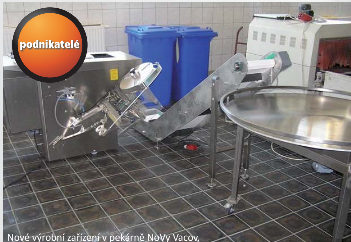
Nové výrobní zařízení v pekárně NoVy Vacov.

„V rámci dalšího zvyšování konkurenceschopnosti firmy bylo potřeba pořídit technologii nezbytnou pro zvýšení kapacity